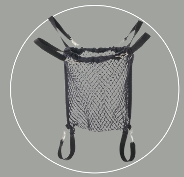
Filet de transport